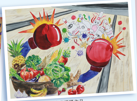
第九屆愛與關懷繪畫比賽得獎作品 繪者:王柏勳